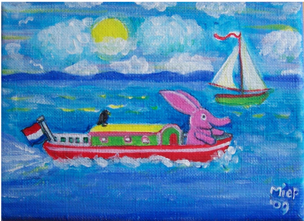
Pinky en Takkie op weg naar huis.