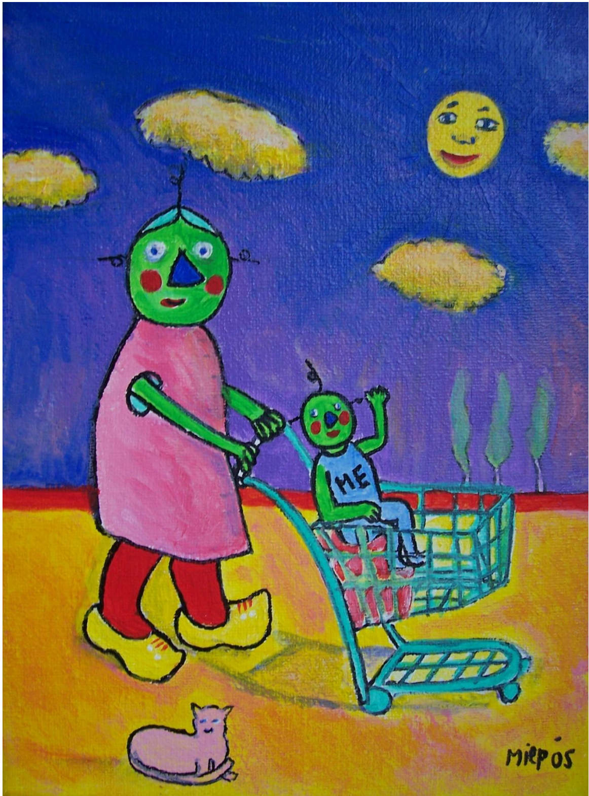
De zielige VoedLab mensen.