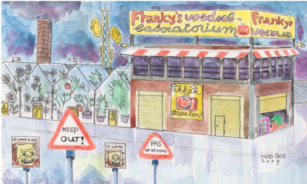
Het VoedLab van Franky Frankenstein.