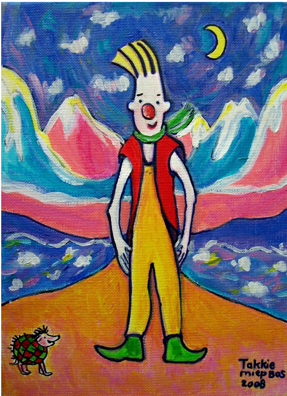
Takkie en de egel.