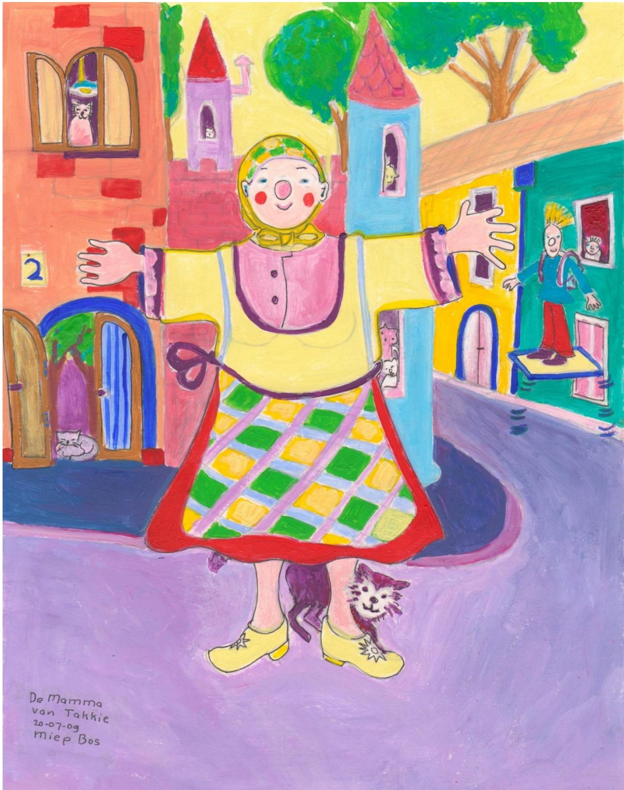
De moeder van Takkie.