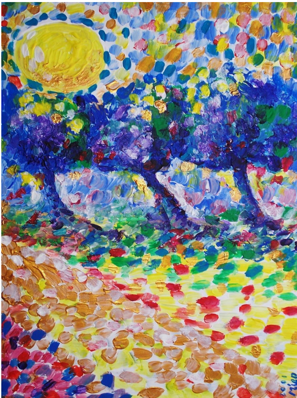
De weg naar Koning Luna en Koningin Luneia, blz. 10.