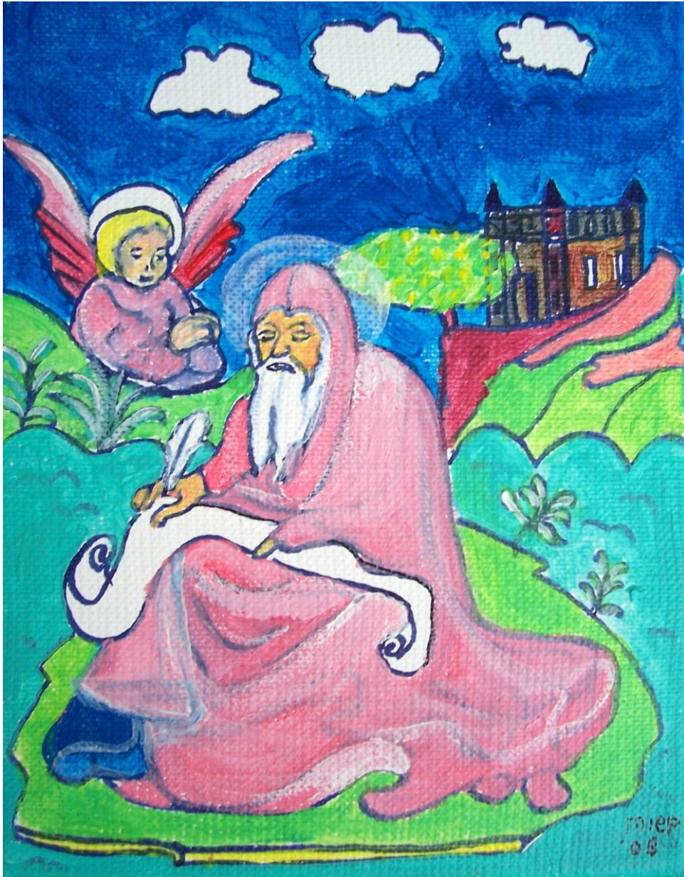
De wijze Rajamya.