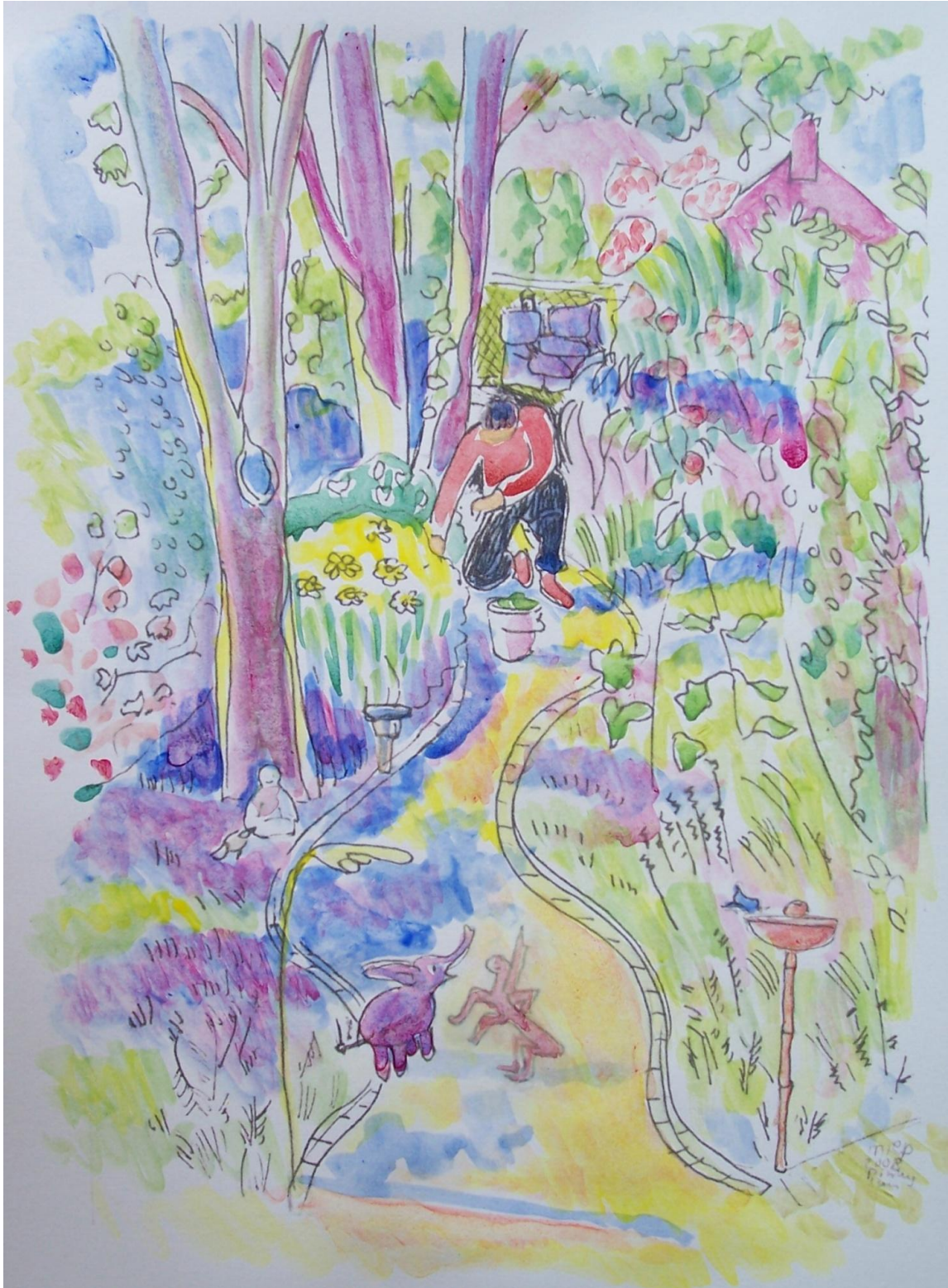
De papa van Pieter is onkruid aan het wieden in de tuin.