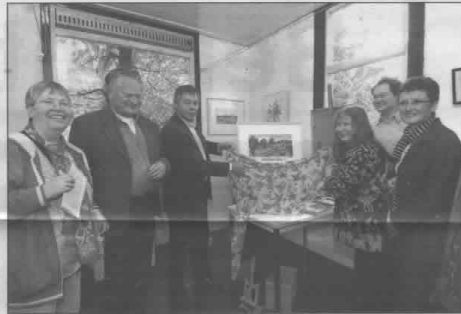
De opening van de gentechnovrije expositie in Atelier Loman.