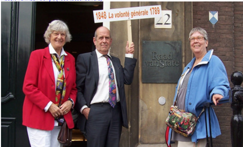
2010 Bij de Raad van State