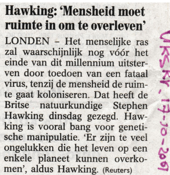
De Stentor 28 mei 2011 door R. Korse.