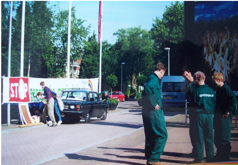
Links spandoek Natuurwetpartij, rechts installatie Greenpeace

2002. Aanwezig bij de startmanifestatie van Eten en Genen: Greenpeace, Theo Tromp, Natuurwetpartij, (met een informatiestand met wat gentschelderijen van Miep Bos) St. Natuurwetmoeders, De Groep Bos (De Stichting Natuurwetmoeders zijn in het boek van Eten en Genen opgenomen met een tekst van hun hand) in 't Spant in Bussum. Foto 3: opbouw stand. http://doc.utwente.nl/44391/1/Terlouw02eten.pdf