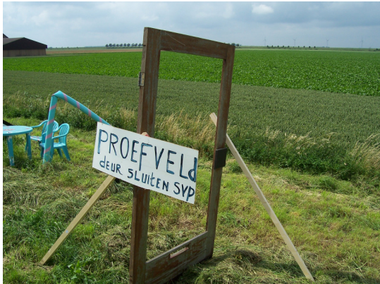
2007 Idem, expositie in Dinteloord.