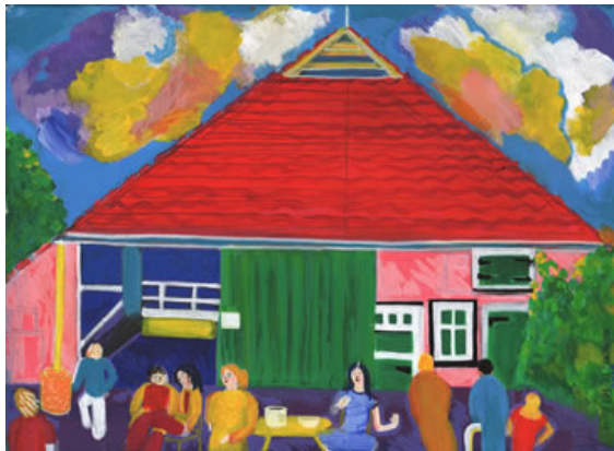
Eco-de-eerste, eerste biologische boerderij in de Noordoostpolder.

Er is een beperkt vermogen om met zogeheten recombinant-DNatechnieken zekere moleculaire kenmerken van de ene soort naar de andere over te dragen. Dit betekent echter allerm minst dat men beschikt over een omvattend en betrouwbaar systeem om te voorspellen wat de effecten van genoverdracht zijn. De totale omgeving waarin het gen functioneel is wordt namelijk niet overgedragen. Wanneer men probeert de auto te starten met het sleuteltje van de brievenbus dan leidt ook dit niet noodzakelijk tot het gewenste resultaat.