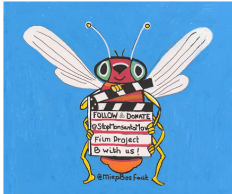
Opdracht logo voor filmproject voorlichting gentechnvrij eten. (USA)