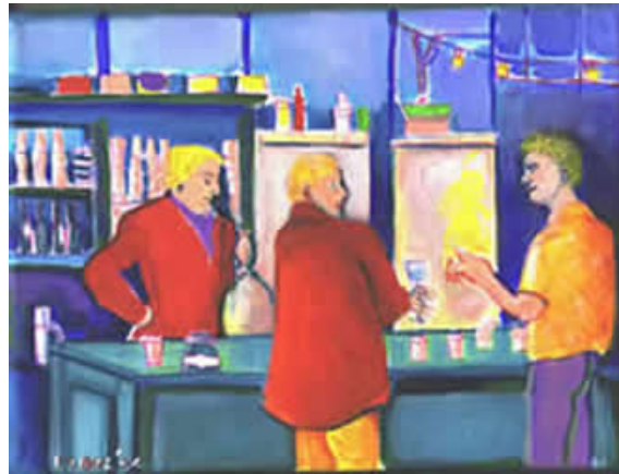
Wat kun je nog gentervrij drinken?

Genetische vervuiling is potentieel vervuiling die zichzelf vermenigvuldigt. Dit kan de kwaliteit van het leven van alle toekomstige generaties van alle levensvormen in het gedrang brengen.