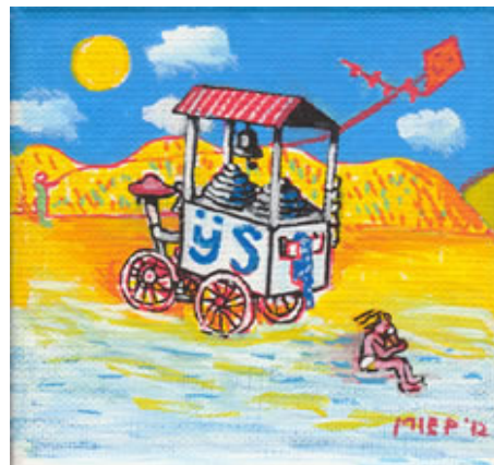
Is wat we eten en drinken nog gentechnvrij?