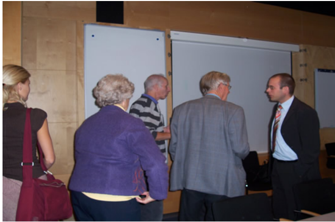
After the hearing in the Hague.